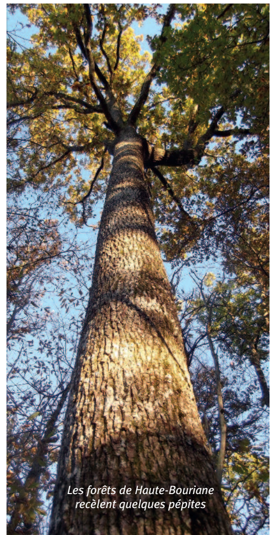
Les forêts de Haute-Bouriane recèlent quelques pépites