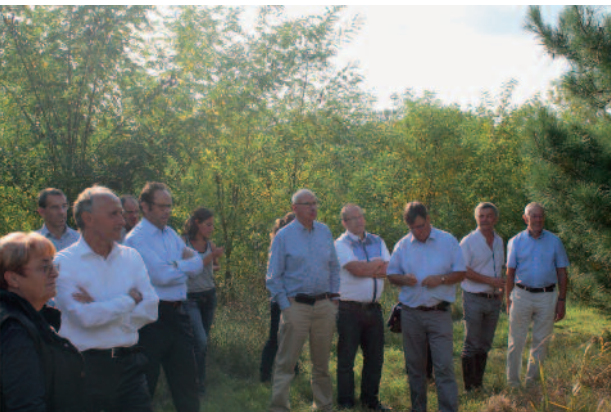
L'actuel Conseil de Centre du CRPF Midi-Pyrénées en tournée forestière, en compagnie d'Antoine d'Amécourt, Président du CNPF et de Jean-Marc Auban, Directeur du CRPF Languedoc-Roussillon

Depuis plus de cinquante ans, les Centres Régionaux de la Propriété Forestière (CRPF) ont été chargés du développement de la forêt privée des régions métropolitaines françaises. Si la fusion des régions est effective depuis le premier janvier 2016, celle des CRPF ne le sera qu'au premier trimestre 2017, après les élections des nouveaux Conseils de Centres.