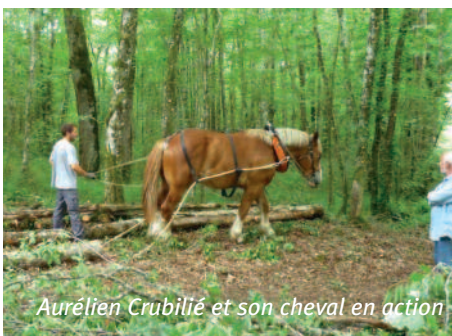
Aurélien Crubilié et son cheval en action

Un jeune entrepreneur motivé, Aurélien Crubilié, s'est même installé en débardage à cheval sur le secteur de