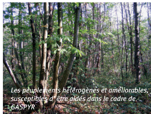
Les peuplements hétérogènes et améliorables, susceptibles d'être aidés dans le cadre de GASPYR

De manière complémentaire, le projet contribuera également au financement de certains investissements matériels : plateforme de dépôts de bois et équipements d'exploitation.