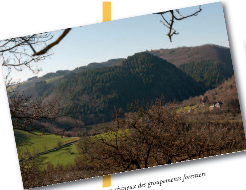
Dans l'Aveyron, les boisements résineux des groupements forestiers occupent fréquemment de fortes pentes

Pour obtenir des informations complémentaires ou demander un bulletin d'adhésion, vous pouvez solliciter directement l'association par mail : agfat12-81@gmail.fr ou contacter Monsieur ETAIX : 05 65 69 72 64.