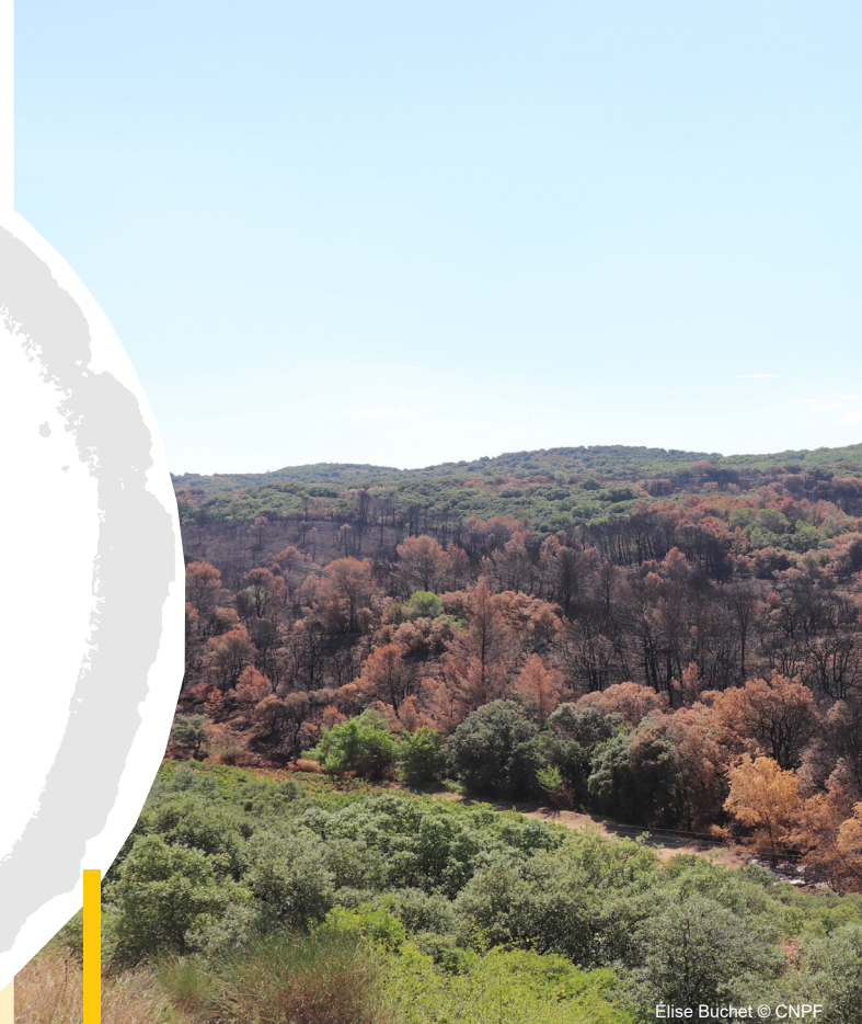
Élise Büchet © CNPF

Les FOGEFOR existent dans toute la France depuis 1983.